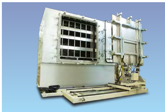
G6サイズクリーンオーブン (連続炉も対応可能)

Incorporates a custom, special heat-resistant filter (newly developed) to achieve a level of cleanliness (Class 10) equivalent to that of an IR oven