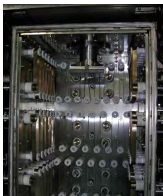
メタルエレメント炉