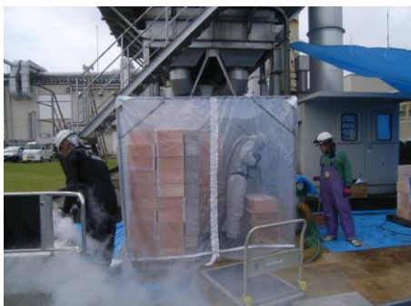
蓄熱体の清掃作業