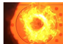
都市ガス専焼火炎

おもに製鋼分野で培った難燃性燃料の燃焼ノウハウをもとに、アンモニア燃焼時におけるNOxと残留アンモニアの課題克服を着実に進めています。