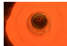
アンモニア専焼火炎