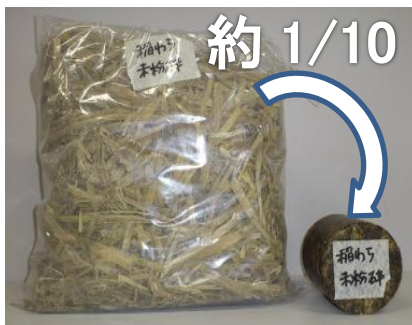
バイオークス化前後の稲わら