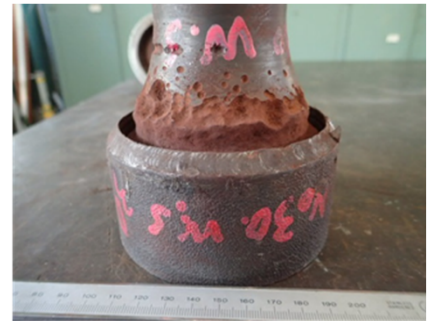
カーボンアタック