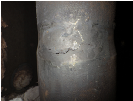
RTチューブクラック