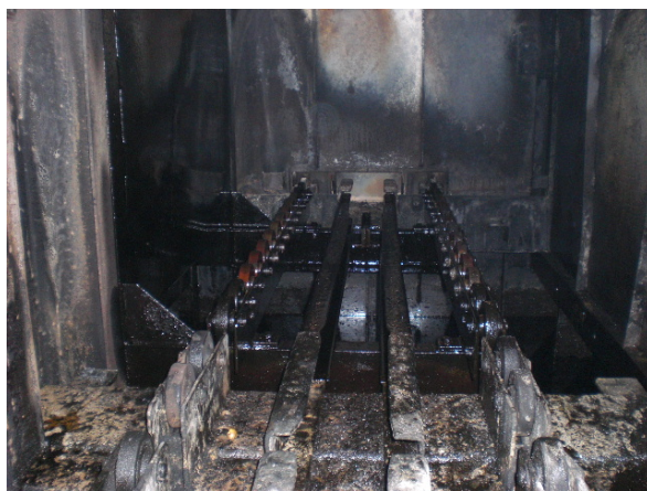
ベスチブル内での異常燃焼による被害状態(例)

ベスチブルに”O 2 センサー”及び、”コントロールユニット”の 設置で酸素濃度管理が可能となります。