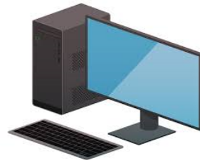
貴社オペレータ室/ 中外炉設計室